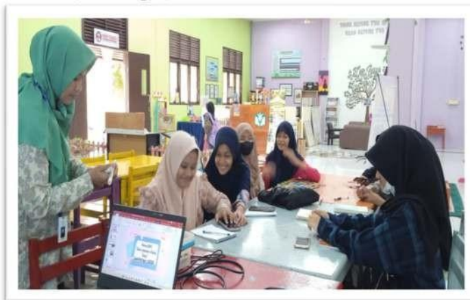
Gambar 8. Bimbingan dan Pelatihan

dikerjakan dalam masa 1 tahun kegiatan. Adapun tujuan ini dilakukan agar pada saat mereka bertugas di perpustakaan LiVo sudah mengetahui apa saja yang dibutuhkan pustakawan dan kegiatan apa saja yang nanti dilakukan guna mengembangkan program perpustakaan. (Terlampir).