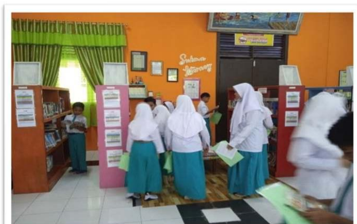
Gambar 4. Resensi Buku