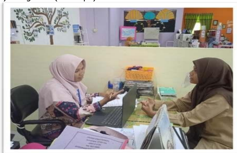
Gambar 5. Wawancara peserta

Saat semua proses rekrutmen LiVo dilakukan, mulai pendaftaran kemudian tes menulis resensi. Dilanjutkan dengan kegiatan tes wawancara. Disini semua calon peserta LiVo mengikuti tes seleksi wawancara dengan tujuan mengetahui sejauh mana keinginan dan tujuan calon LiVo bergabung menjadi bagian perpustakaan. Pada tahap wawancara, semua peserta diundang ke perpustakaan dan bertemu dengan pustakawan yang ada diruang perpustakaan. Setiap peserta diberikan waktu 5 menit perorang untuk menjawab setiap pertanyaan yang dibuat dalam form wawancara. Informasi kegiatan wawancara disampaikan dengan flyer kegiatan. (Terlampir).