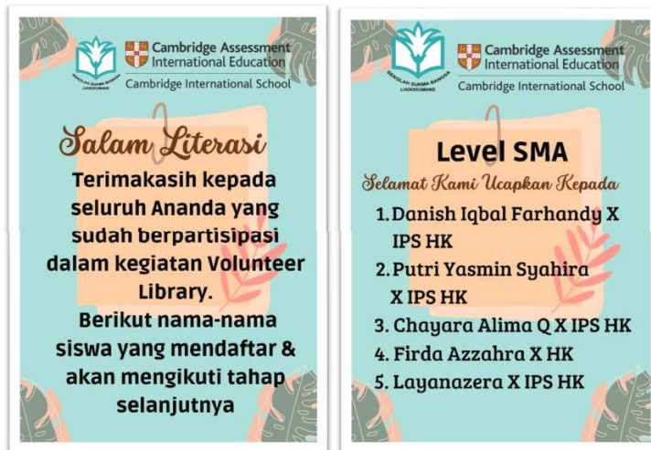
Gambar 6. Flyer Pengumuman Kelulusan Peserta