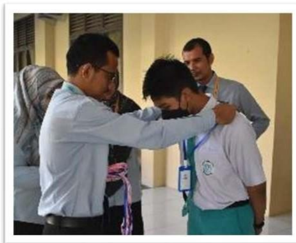
Gambar. 7 Pelantikan LiVo

Setelah melalui proses registrasi, tes tulis dan wawancara. Tiba saatnya proses penerimaan menjadi anggota yang sah. Penerimaan ini dilakukan sebagai bukti bahwa peserta yang lulus dari tahap yang sudah dilakukan akan melalui proses pelantikan. Pelantikan disini merupakan sebuah bukti keikutsertaan para anggota dan merupakan ciri apresiasi dari pelaksanaan kepada anggota yang terlibat dalam program perpustakaan. Pelantikan bagi anggota yang terlibat ditandai dengan pemberian ID Card sebagai penanda lainnya dari pemustaka. Kemudian setelah dilantik menjadi bagian dari program perpustakaan barulah peserta dapat berkontribusi dan terlibat dalam kegiatan perpustakaan. Pemberian penanda pada anggota LiVo merupakan ciri dari adanya LiVo di lingkungan sekolah. Dengan demikian akan menjadi pemantik dan daya tarik bagi pemustaka lainnya. Nantinya LiVo ini akan terus diminati dan menjadi program unggulan perpustakaan.