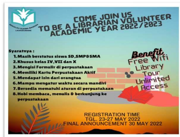
Gambar 3. Flyer Kegiatan

Pada tahap ini, pustakawan sekolah menyiapkan flyer berupa informasi terkait kegiatan. Didalam flyer terdapat informasi terkait persyaratan peserta serta jadwal kegiatan. Selain itu, flyer juga disampaikan melalui forum diskusi WAG dengan manajemen sekolah untuk mendapatkan masukan dan persetujuan bahwa kegiatan akan dimulai. Setelah Flyer disetujui pihak manajemen sekolah, kemudian Flyer dibagikan melalui media sosial dan grup WA sekolah.