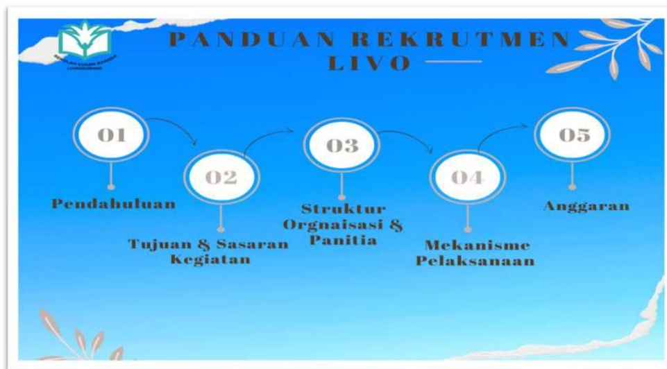
Gambar 1. Panduan Rekrutmen

Dalam proses rekrutmen LiVo ini mengacu pada panduan yang sudah dibuat sebelum dilaksanakan. Berikut mekanisme proses kegiatannya.