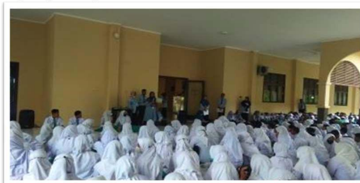
Gambar 2. Pada Saat Sosialisai

Pada tahap sosialisasi rekrutmen LiVo dilakukan dengan beberapa cara, diantaranya sosialisasi secara langsung kepada seluruh siswa Sekolah Sukma Bangsa Lhokseumawe. Sosialisasi yang dilakukan dalam rekrutmen adalah pengenalan dan pemberitahuan apa itu LiVo, tujuan dan manfaat menjadi bagian LiVo kepada siswa. Sosialisasi ini disampaikan kepada seluruh siswa walaupun hanya rekrutment khusus kelas X. Pada proses sosialisasi dilakukan bertepatan dengan kegiatan keagamaan Asmaul Husna.