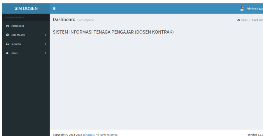
Gambar 3. Form Menu Utama