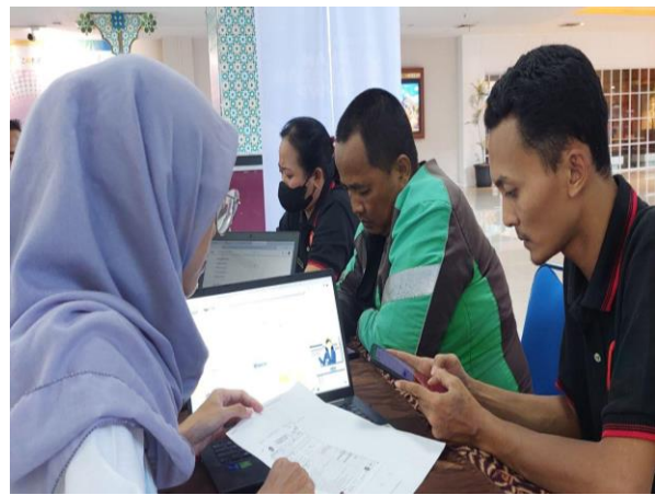
Gambar 4. Pendampingan Pengisian SPT Tahunan Orang Pribadi di Mall Ciplaz Sidoarjo

Hasil Pengabdian Masyarakat Pendampingan Pelaporan SPT Tahunan Orang Pribadi Melalui E-Filing di Mall Ciplaz Sidoarjo melalui program kegiatan Relawan Pajak UNUSIDA dengan KPP Sidoarjo Selatan dinilai sangat baik tahun ini dan sangat membantu Asistensi selama kegiatan berlangsung. Indikator keberhasilan program tersebut dapat dilihat karena pada tahun ini banyak masyarakat Sidoarjo yang melapor, dan dari data kinerja penyampaian surat pemberitahuan tahunan pajak atau SPT tahun 2022 tumbuh sebesar 2,84% dibandingkan periode yang sama tahun lalu, walaupun tipis tapi ini membuktikan bahwa terjadi peningkatan masyarakat yang telah melakukan kewajiban perpajakan melaporkan SPT Tahunan yang telah dibayar selama tahun berjalan, yang berarti kegiatan Relawan Pajak UNUSIDA telah terealisasi dengan baik (Theodora, 2023).