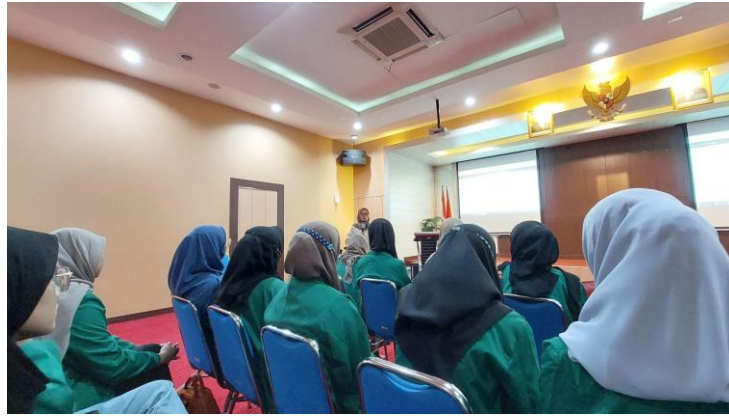
Gambar 3. Pelatihan dan Pembekalan Relawan Pajak UNUSIDA