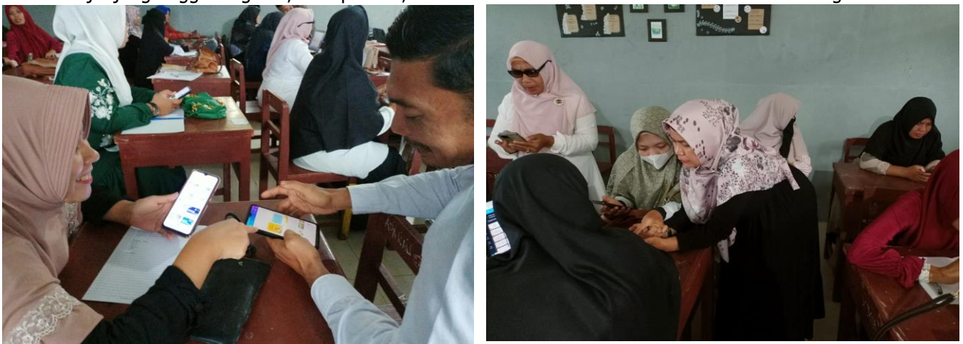
Gambar 1 : Gambar Kegiatan Pelatihan, 2023