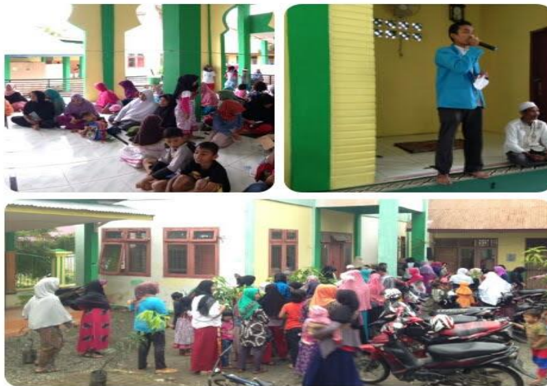
Gambar 2. Pada Saat Proses Pelatihan