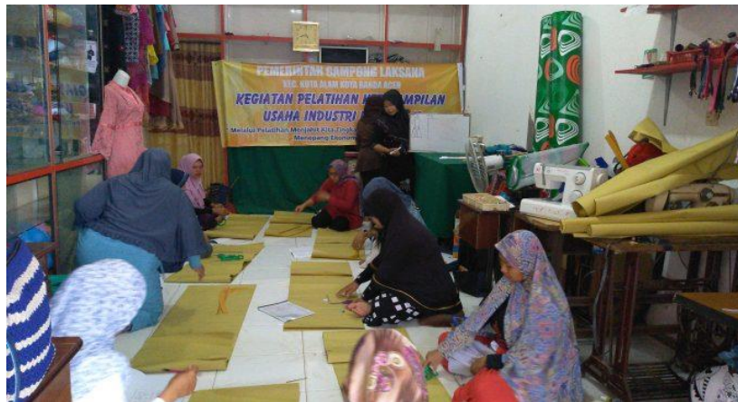
Gambar 1. Pada saat Pelatihan Menjahit

Pelatihan tersebut diadakan di rumah tutor menjahit. kegiatan ini merupakan usulan adari masyarakat, hasil dari dukpakat desa sehingga penetapan usulan itulah yang kami jelankan kegitan ini merupakan hasil dari musyawarah desa, sehingga menjahit menjadi pilihan msyarakat. Berikut gambar pada saat pelatihan (Laksana, 2018). Pelatihan menjahit merupakan program lanjutan dari program dana desa dalam bidang pemberdayaan masyarakat.