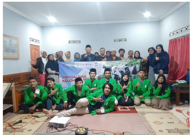
Gambar 3. Peserta dan Panitia Program Pengabdian Kepada Masyarakat.