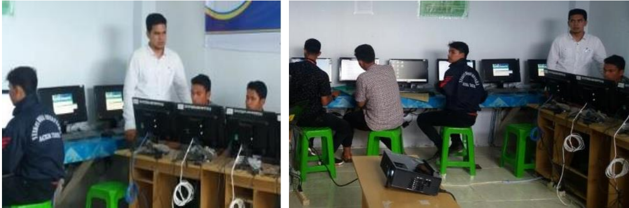
Gambar 1, Pada Saat Proses Pelatihan