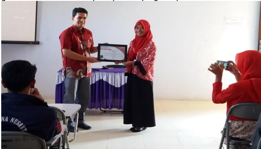
Gambar 2, Penyerahan Sertifikat Untuk Peserta

Tahap ketiga adalah kegiatan monitoring. Kegiatan ini dilaksanakan untuk memastikan bahwa materi yang disampaikan benar-benar dapat diterapkan dalam kegiatan dalam melayani masyarakat untuk membuat dokume atau arsip. Kegiatan monitoring ini memiliki sifat teknis, di mana memberikan pengujian praktik penggunaan dan pengarahan melalui komunikasi tidak langsung maupun langsung ketika kegiatan berjalan ditemukan kendala lainnya, Disebabkan terjadinya keterbatasan waktu dan sarana dan prasarana seperti laptop dalam kegiatan pengabdian kepada masyarakat ini, dan untuk lebih efektif dilakukan monitoring melalui group whatsapp, dan dengan memberi kuisioner kepada peserta yang ikut pelatihan tersebut.