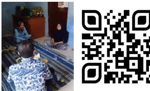
Gambar 2. Dokumentasi Kunjungan ke Anggota Koperasi.

Kegiatan sosialisasi tahap pertama dilakukan dengan mendatangi langsung rumah-rumah warga yang tergabung dalam keanggotaan koperasi untuk menggali informasi terkait pengelolaan usaha yang selama ini telah dilakukan, dari hasil penelusuran dilapangan mayoritas anggota koperasi dalam menjalankan usahanya tidak memperhitungkan prinsip ekonomi usaha sehingga mayoritas usaha yang dijalankan tidak bertahan lama. Gambar 2 merupakan dokumentasi kegiatan sosialisasi awal dirumah warga yang menjadi anggota koperasi.